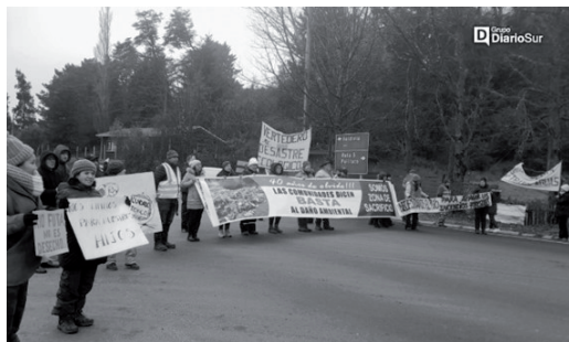
Imagen 3. Corte de la ruta T-60 por parte de comunidades de Morrompulli.

En julio de 2024 las comunidades movilizadas cortaron la ruta T-60 (véase la imagen 3). «¡¡40 años de olvido!! Las comunidades dicen basta al daño ambiental. Somos zona de sacrificio», se podría leer en un pasacalle, lo que muestra la apropiación del tropo «zonas de sacrificio» por parte de las comunidades como herramienta de denuncia del desastre ambiental y su invisibilización durante cuatro décadas y para dar cuenta de acciones comunitarias contra la basurización (Vázquez, 2023) frente a la concentración de los costos del progreso (Fol y Pflieger, 2010) en la localidad.